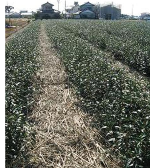
刈りとったヨシを茶畑の敷ワラとして利用