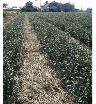
刈り取ったヨシを茶畑の敷ワラとして利用