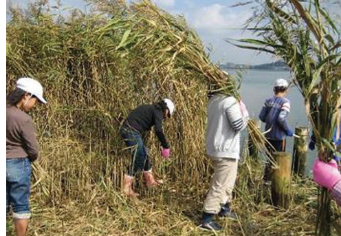
ヨシ刈りイベントの様子