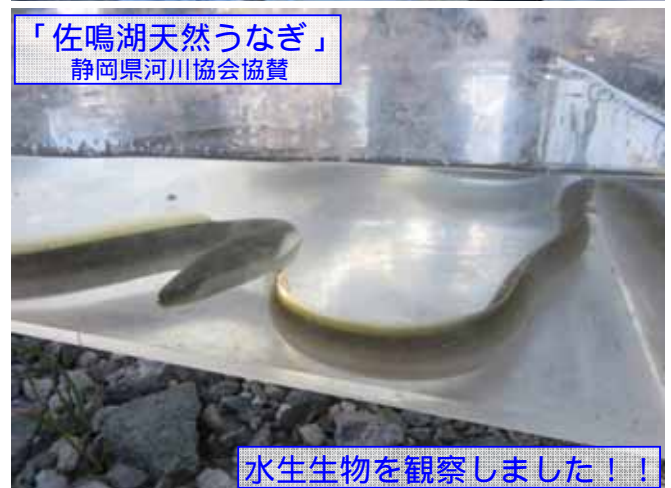
「佐鳴湖天然うなぎ」 静岡県河川協会協賛