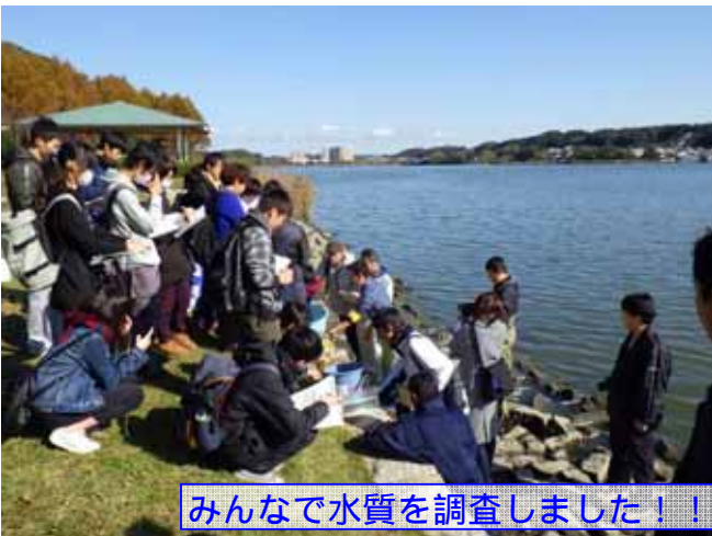
みんなで水質を調査しました！！

本調査は、COD値や透明度といった水質項目と併せて、湖に生息する生物や水のおい、ごみの量などを地域の皆さんと一緒に測定します。これにより、多くの方々とともに多様な視点から佐鳴湖を調べ、佐鳴湖の実態を“体感”しながら、正しく知っていただくとするものです。