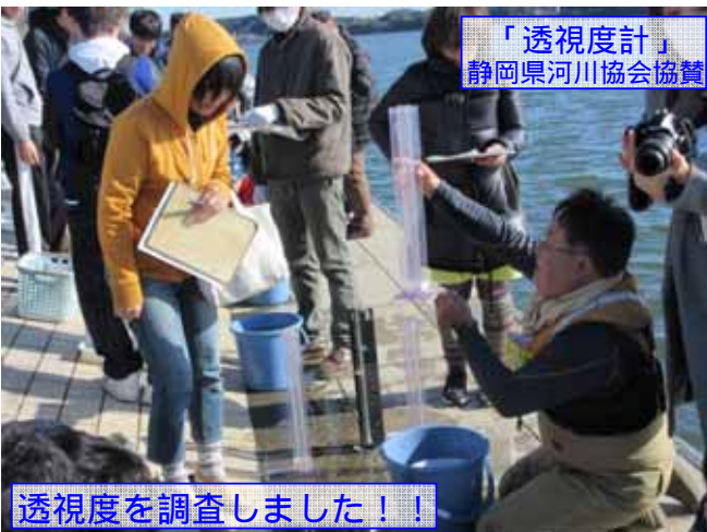
「透視度計」 静岡県河川協会協賛