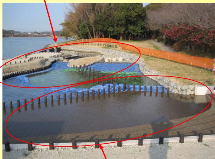
水と触れあえる場