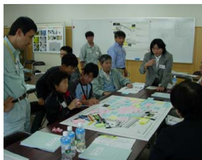
計画図作成のためのワークショップの様子