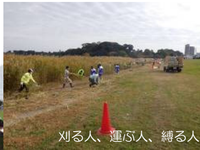
刈る人、運ぶ人、縛る人、みんなで手分けし手際よく！！