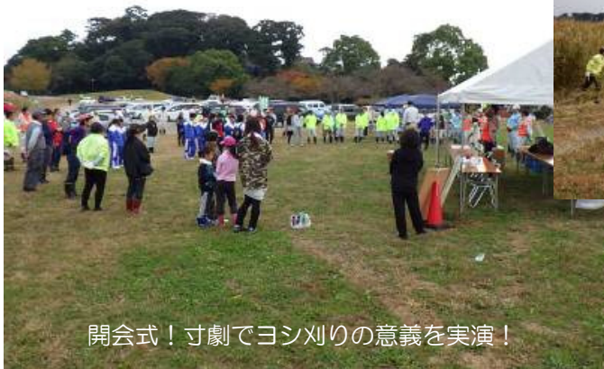
開会式！寸劇でヨシ刈りの意義を実演！