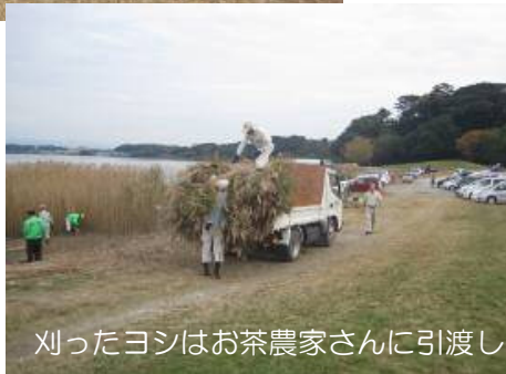
刈ったヨシはお茶農家さんに引渡し